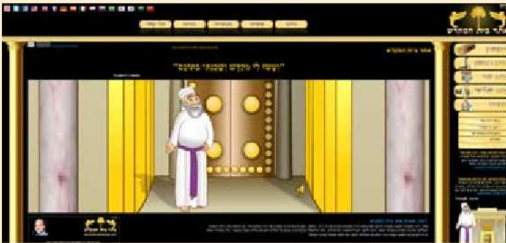
אתר המקדש www.bait-hamikdash.co.il

"מאז שהייתי ילד קטן. זה נשמע קצת משוגע, אבל גדלתי בבית מסורתי, לא דתי ולא חרדי, וכבר בגיל 6, כשהיו מדברים על בית המקדש – היה נדלק אצלי משהו בראש. הייתי שואל על כל דבר מה זה, מה הסיבה. מאוחר יותר גיליתי שבאפגניסטן היינו משפחה מוכרת: ארבעה דורות